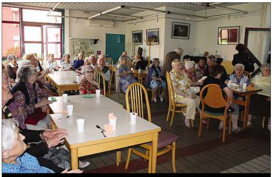
FOYER ALEXANDRE-VARENNE. Un concert avec l'orchestre Les Hérissos pour bien commencer l'été.

Les premiers interviennent plusieurs fois par semaine au foyer pour dis-